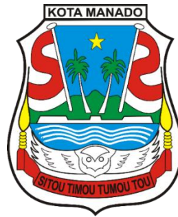
Gambar 1.2 Logo Kota Manado