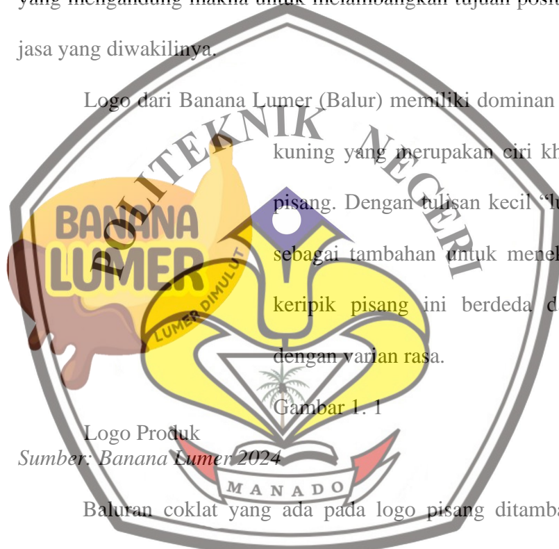
Gambar 1. 1

Logo dari Banana Lumer (Balur) memiliki dominan dengan warna kuning yang merupakan ciri khas dari warna pisang. Dengan tulisan kecil “lumer dimulut” sebagai tambahan untuk menekankan bahwa keripik pisang ini berbeda dari yang lain dengan varian rasa.