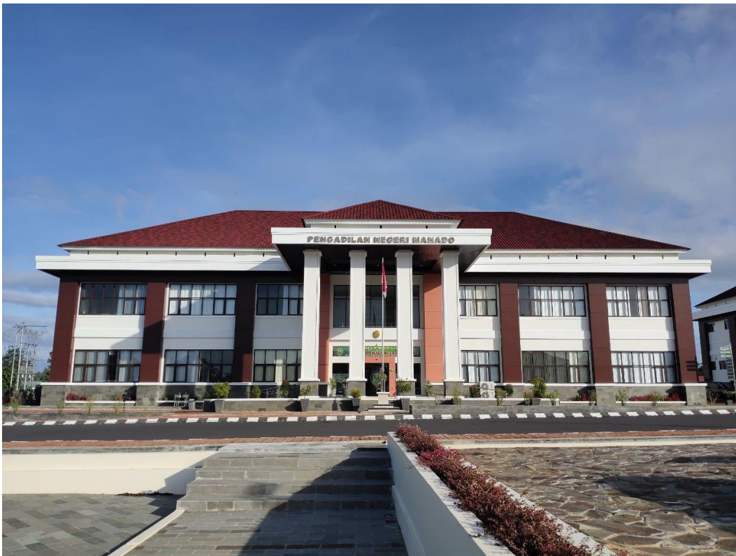
Gambar 2 Gedung Pengadilan Negeri Manado

Kantor Pengadilan Negeri Manado berlokasi di Jalan Prof. Raden Soelaiman Efendi Koesoemah Atmadja, Kelurahan Kima Atas, Kecamatan Mapanget, Manado, Kompleks Pengadilan Terpadu.